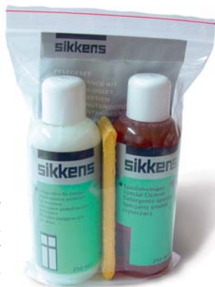
Udržovací sada – Pflegeset: Speciální čistič a emulze Pflegemilch.

K čištění používejte pouze obvyklé neutrální čisticí prostředky. V žádném případě neužívejte abrazivní čisticí písků a krémy, dále se vyhněte čisticím, která obsahují kyseliny a organická rozpouštědla – poškozují povrch laku.